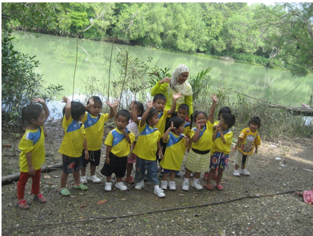
ได้ปลูกฝังให้เด็กรักป่า และสัตว์ต่างๆที่อยู่ในป่าเด็กจะได้ไม่ทำลายป่า