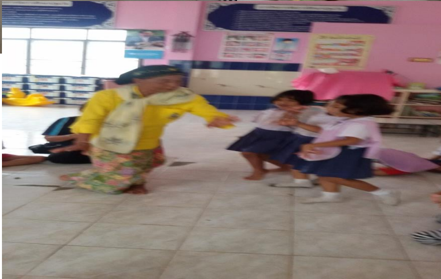
ฝึกให้เด็กทำตาม