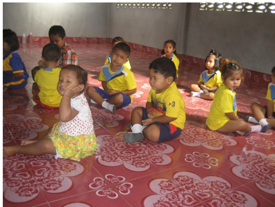
เด็กนั่งสมาธิ