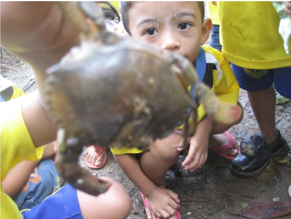
สัตว์น้ำ ปุเด็กได้เห็นของจริงแหละได้เรียนรู้การเป็นอยู่แหล่งที่อยู่อาศัยของปู ปลา กุ้ง หอย