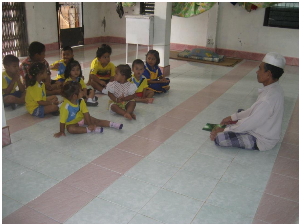
เด็กนั่งฟังโต๊ะอิหม่ามพูดคุยถึงคุณธรรมจริยธรรมที่เด็กควรรู้และนำไปปฏิบัติได้อย่างเหมาะสมกับวัย