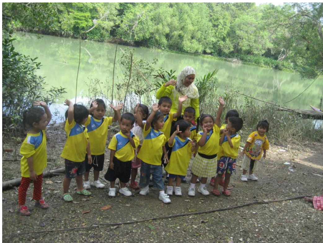
นำเด็กไปเยี่ยมชมป่าชายเลนให้เด็กได้สัมผัสและได้เรียนรู้จากของจริง